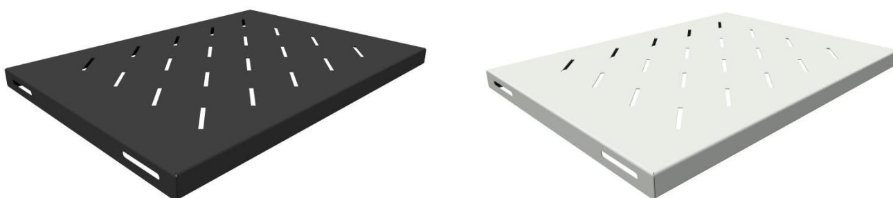
Рисунок 1 - Общий вид стационарной полки

Полка стационарная предназначена для установки оборудования весом до 20 кг в напольных телекоммуникационных шкафах и стойках. Выполнена из прочного стального листа и покрыта качественной ударопрочной-порошковой краской черного/серого цвета (RAL 9005/7035). Для облегчения конструкции и обеспечения естественной вентиляции за счёт конвекции на поверхность полки имеет перфорацию. Установка полки осуществляется за счёт её крепления к монтажным профилям шкафа в четырёх точках. Полка предназначена для шкафов габаритной глубиной 600 мм. Полка поставляется в индивидуальной картонной упаковке. Полка поставляется в индивидуальной картонной упаковке. Общий вид консольной полки изображен на рисунке 1.