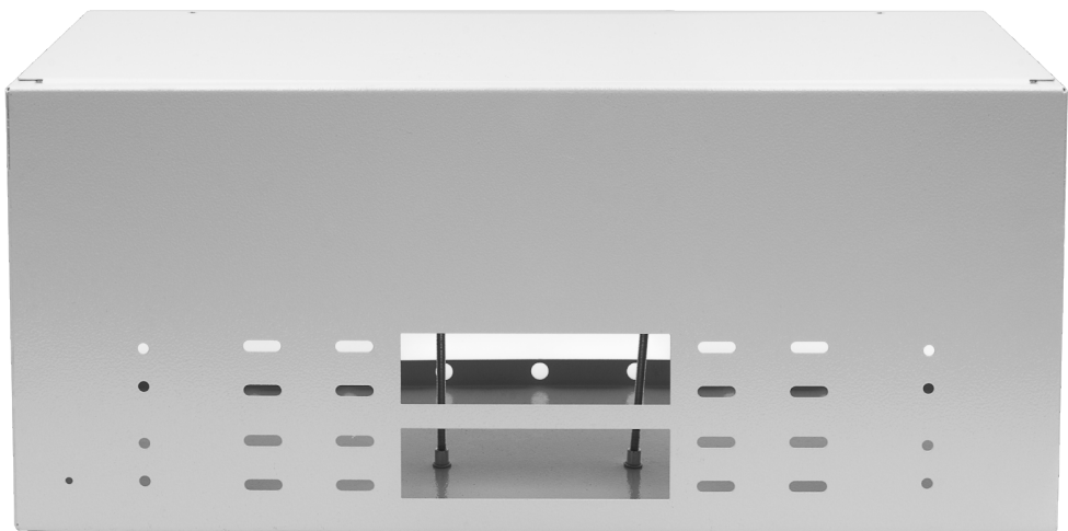
Рисунок 2 - Кабельные вводы