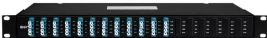
Рисунок 1 - Общий вид